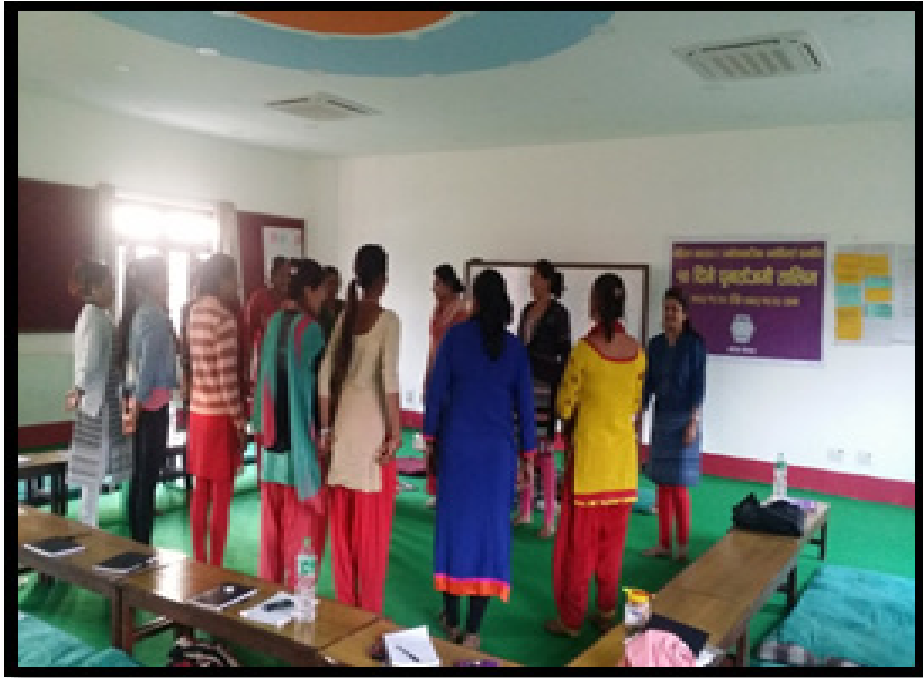
तालिमको क्रममा गरिएको क्रियाकलाप